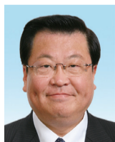
松本 洋之 団長/幹事長/ 議会運営副委員長/総務財政委員/ オリンピックパラリンピック 観光推進特別委員