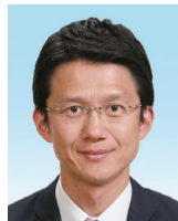
末安 広明 政調会長/総務財政副委員長/ 議会運営委員/ オリンピックパラリンピック 観光推進特別委員