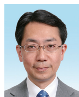
秋成 靖 都市整備副委員長/ オリンピックパラリンピック 観光推進特別委員