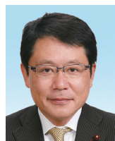
勝亦 聡 幹事長/オリンピックパラリンピック 観光推進特別委員長/ 健康福祉委員/議会運営委員