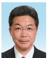
田村 英樹 副幹事長/ 羽田空港対策特別副委員長/ こども文教委員/議会運営委員