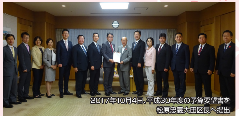
2017年10月4日、平成30年度の予算要望書を松原忠義大田区長へ提出

大田区平成30年度予算では、「次代を担う子どもたちの育ちを、切れ目なく応援する取り組み」「生涯を通して誰もが健やかに、安心して暮らせるまちづくり」「地域力を活かし、にぎわいと安らぎが調和したまちづくり」「まちの魅力を磨き、世界に輝く国際都市おおたを創造・発信する取り組み」の4つを重点課題と位置づけ、一般会計予算2,787億7千万円余、