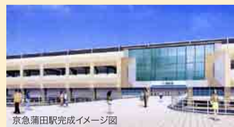
京急蒲田駅完成イメージ図

しかし、「新エアポート快特」が京急蒲田駅に停車しないというダイヤ改正があり、大田区として、5月15日に「京急蒲田駅通過反対区民大会」を開催し抗議文を採択、5月24日に回答がありました。極めて不十分、到底納得できるものではありませんでした。今後も区議会公明党として、この問題の解決のために取り組んでまいります。